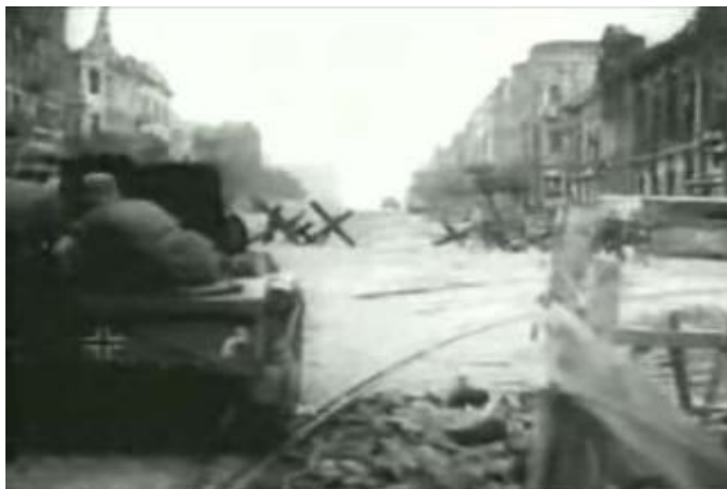
Рис. 2. Бои в Ростове-на-Дону, 1942 г. На переднем плане – противотанковые ежи. (URL: http://rudocs.exdat.com/docs/index-178889.html?page=5 ( дата обращения: 12.11.2014)