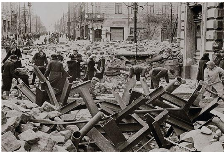
Рис. 1. Жители Ростова-на-Дону строят баррикады. 1942 г. (URL: http://img12.nnm.ru/imagez/gallery/d/5/e/9/f/d5e9f116e593f9d1b511b53b99e30228_full.jpg , дата обращения: 12.11.22014)

4 июня 1942 г. городской комитет обороны принял решение: вывести на строительство баррикад, рвов, эскарпов, надолбов «столько людей, сколько нужно для завершения их строительства»; «удлинить рабочий день на строительстве баррикад – организовать работу в 2 смены, а если нужно, то и в 3»; «подвоз материалов (ввиду отсутствия транспорта) осуществлять вручную, на домашних телегах». Форсировалось строительство обводов на